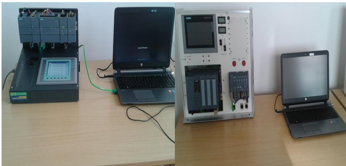
Рисунок 1-Лабораторные стенды фирмы SIEMENS на базе SIMATIC S7-1200 с HMI , SIMATIC S7-1500 с HMI и SCADA-системы на базе WinCC

промышленная комплексная автоматизация многоуровневыми технологическим процессами со сбором данных через Ethernet на OPC-сервере с подключением по локальным сетям всех технологических параметров на графические интерфейсы SCADA-системы с возможностью отображения социально значимой информации на сайтах интернета в режиме он-лайн.